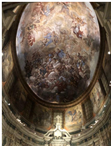
Cattedrale San Cataldo - #WeHostInPuglia

Nella città vecchia è possibile visitare la Cattedrale di San Cataldo, la più antica cattedrale Pugliese e si trova in Piazza Duomo la facciata settecentesca è un trionfo Barocco, l'interno è lungo 84 metri e composto da tre navate e numerose cappelle. Della vecchia costruzione medioevale rimane solo la cripta risalente al X secolo ove si possono ammirare alcuni affreschi databili al 1400. Per ulteriori informazioni storiche si rimanda al sito ufficiale della cattedrale