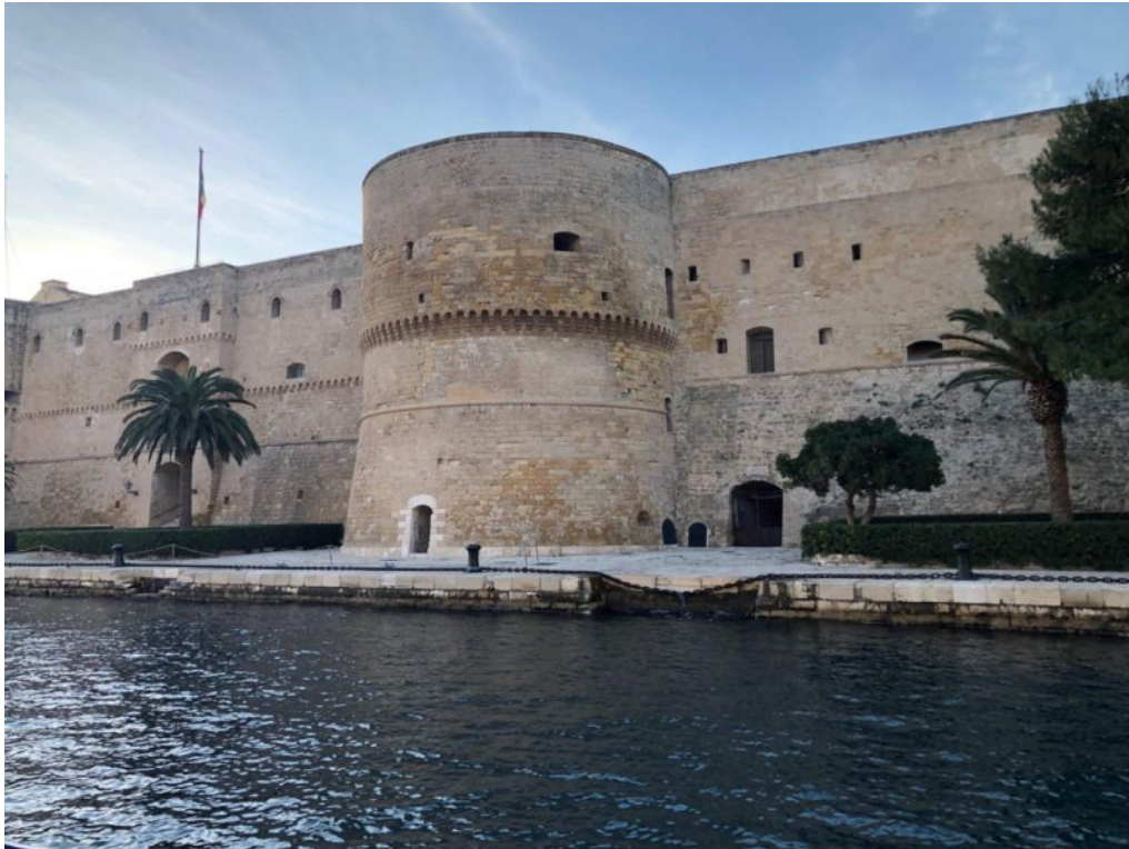
Castello S. Angelo Taranto